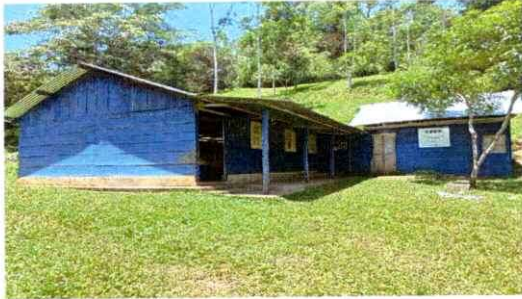
Foto1: Las columnas que fueron hechas anteriormente estan en mal estado por las inclemencias del tiempo, por lo tanto se mejorara.