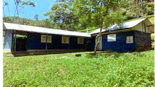
Foto 2: las puertas y ventanas estan en mal estado por lo tanto se realizara un cambio, al igual que las paredes cuentan con block sin embargo ya no se encuentran en muy buen estado.